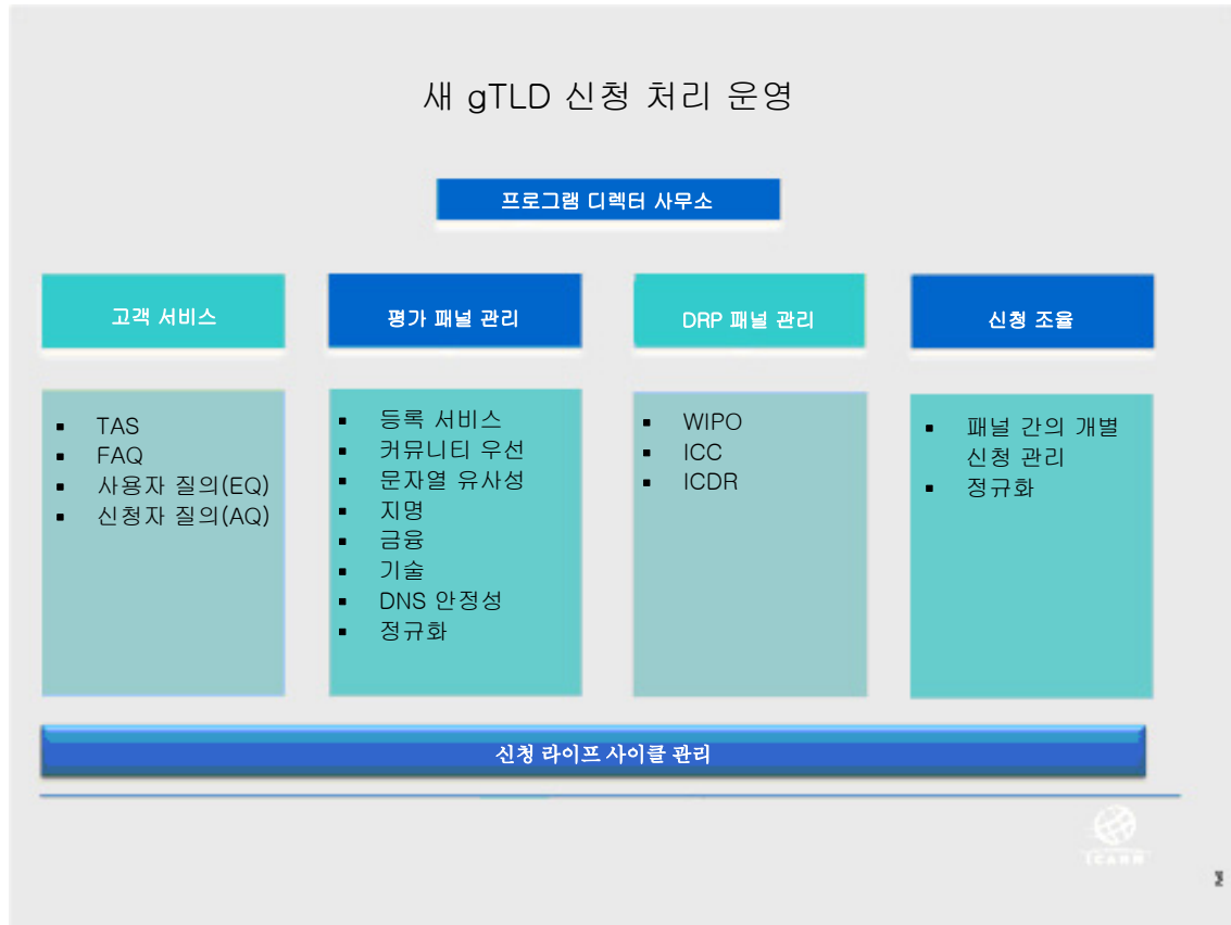
예시 3: 신청 처리 조직